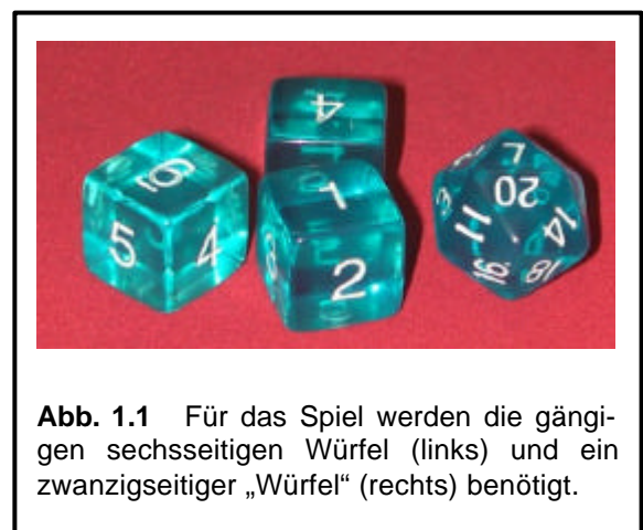
Abb. 1.1 Für das Spiel werden die gängigen sechsseitigen Würfel (links) und ein zwanzigseitiger „Würfel“ (rechts) benötigt.